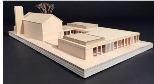
Bildquelle: www.rp-online.de ; Dreibund